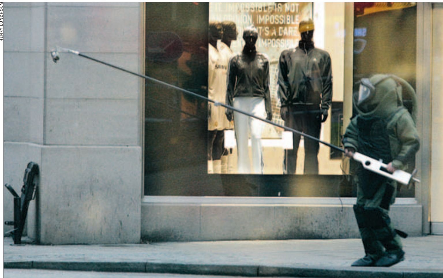
EN BOMBTEKNIKER BÄR BORT en del av det som misstänktes vara bomber. Ett stort område runt korsningen Sveavägen/Kungsgatan spärrades av.